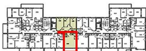
plan sytuacyjny z lokalizacją apartamentu