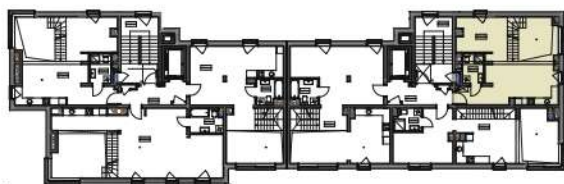
plan sytuacyjny z lokalizacją apartamentu